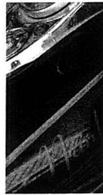
NANKY LEYLA ES SU NICK M