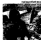
CINCO HORAS ESPERAN.

Las raciones, las cuales fueron repartidas durante el día junto a los restantes cargamentos que llegaron ayer, alimentaron además a las 600 personas albergadas en Camiña, Chapiquita y Yala-Yala.