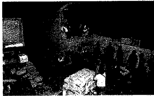
UNA CABA DE ALIMENTOS PARA UN DÍA A DOS PERSONAS.

Para los cuatro militares que transportaron la carga, la cantidad de alimentos que contiene el paquete enviado por la Onemi permite que una fami-